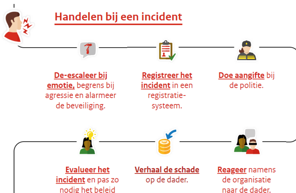
Afbeelding 3. Stroomschema 'Handelen bij een incident' 4

Dreigt iemand met geweld en gaat hij slaan, spugen of spullen vernielen? Beëindig dan onmiddellijk het gesprek en stuur degene weg. Schakel daarbij de beveiliging in. Zorg altijd eerst voor je eigen veiligheid. Doe bij een strafbaar feit ook altijd aangifte bij de politie.