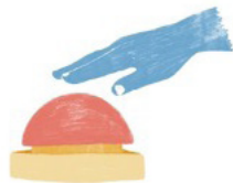
Figuur 2 Rode knop (uit Potjer, 2019)

Een tweede voorbeeld van de inventieve octopus is het reeds afgeronde 'Ruimte voor de Rivier'-programma (dat liep van 2006-2019). In dit programma verbeterden Rijk en regio's (oftewel provincies, gemeenten, waterschappen en maatschappelijke partners) samen de waterveiligheid en ruimtelijke kwaliteit van riviergebieden in Nederland. Het programma wordt breed gezien als een zeer geslaagde publieke samenwerking. Wat een belangrijke rol speelde, was het ingenieuze 'omwisselbesluit': een juridisch instrument waarmee het Rijk een uitnodiging deed naar de regio's om met lokale en creatieve voorstellen te komen voor de voor hun betreffende riviergebieden. Het Rijk formuleerde de plannen en doelen op hoofdlijnen, maar scheidde door middel van het omwisselbesluit de formele mogelijkheid om stukjes van dat plan 'om te wisselen' met betere lokale invullingen. Dit ontwerp zette iedere bestuurslaag in haar kracht – het Rijk coördinerend en richtinggevend, de regio's met de creatieve zoekruimte om voorstellen te ontwikkelen die lokaal